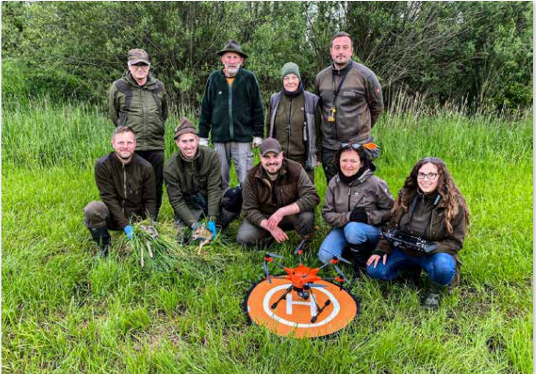
Team 02 im Einsatz