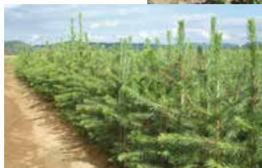
Fichten 2+1 ZüF