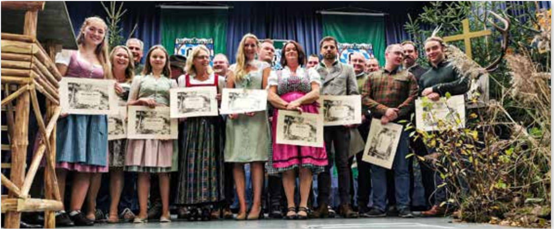
Unsere diesjährigen Jägerprüfungsabsolventen