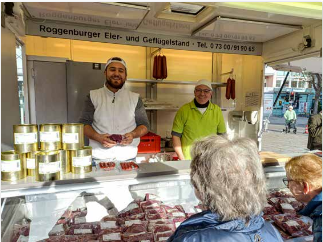
Verkauf der Metzgerei Klein auf dem Neu-Ulmer Wochenmarkt