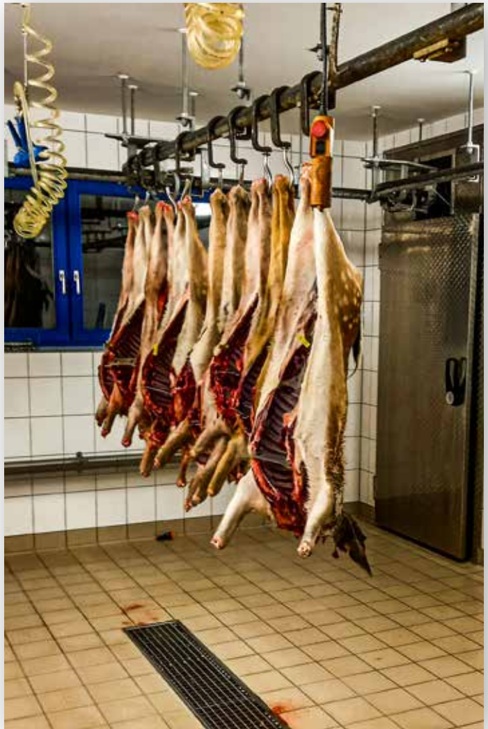
Aufgebrochenes Wild in einer Zerwirkeinrichtung

Die Sorge vor einer Verbreitung der Afrikanischen Schweinepest (ASP) auch in Deutschland hat dazu geführt, dass im Rahmen des Monitorings vermehrt Proben vom Wildschwein auf Erreger