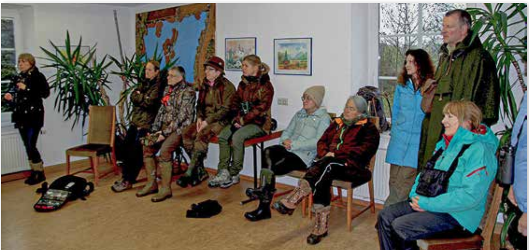
Einführung in der Geschäftsstelle